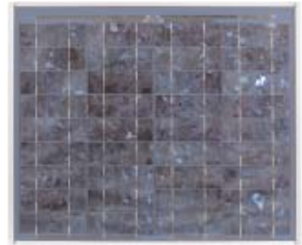
BP SX 20U échelle 1:9

Certifiés par Factory Mutual research pour application en sites à risque au NEC Class 1, Division 2, Groupes C & D, et certifié pour usage dans les systèmes jusqu'à 600V (BP SX 20U)