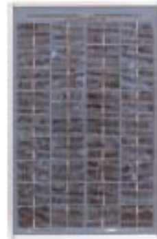
BP SX 10U échelle 1:9

Certifiés par Factory Mutual research pour application en sites à risque au NEC Class 1, Division 2, Groupes C & D (BP SX 10U)