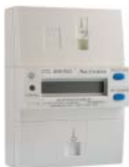
► Compteur Multitarif Monophasé

Spécialement conçu pour les clients résidentiels, le compteur monophasé ACE2000 A14C4 équipe les comptages à branchement direct dont la puissance est inférieure à 18kVA.